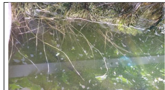
Foto: Mooie wortel-uitlopers ondanks vervuiling en droog hangende worteldelen

Er zijn geen symptomen van Fusarium tot nu toe gevonden.