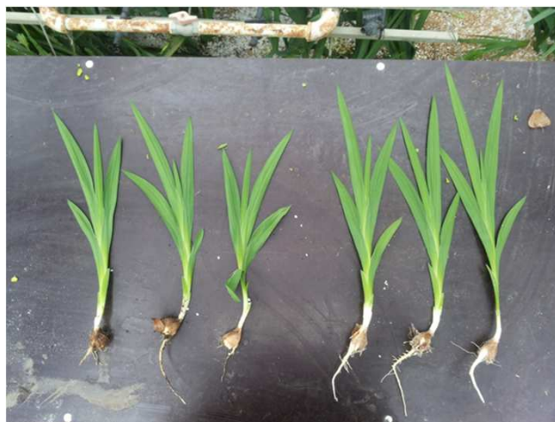
Figuur 5: Freesia geteeld in grond (links) en in zandbed (rechts).

Het onderzoek in de freesia teelt richt zich op: