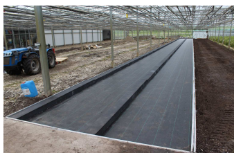
Figuur 1. inrichting van het systeem: erfgoedvloer met verwarming/koeling. System wordt gevuld met zand (0-1 mm).

Het systeem bestaat uit een zandbed (fractie 0-1 mm) waar via de regenleiding of druppelirrigatie voedingswater gegeven wordt. Het zandbed is aangelegd op een erfgoedvloer voor uniforme drainage. In deze ondervloer zijn per bed van 1,2 m breed 10 verwarmingsslangen aangelegd. In de teeltlaag zijn 8 slangen aangelegd. De ondervloer maakt eb/vloed mogelijk, maar in eerste instantie wordt gewerkt met de regenleiding en druppelleiding.