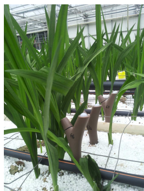
Figuur 4: Zandbed met vochtsensoren.