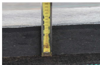
Figuur 2: buitenring is 14 cm. Binnen afscheiding 12 cm hoog.