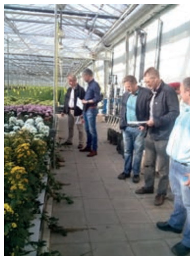
Foto Bewortelingsruimte bij De Sarskampen (l) en beoordeling van rassenproef (r).

Met de Demonstratieregeling van EZ ('Schoon en Zuinig') en investering van Kreling BV is het daarop in 2013 mogelijk geworden om in Bruchem een faciliteit van 800 m 2 teelt op water te installeren. Alle betrokkenen bij het onderzoek van de voorgaande jaren hebben deelgenomen aan de begeleiding van deze demonstratieproef om zo kennisdoorstroming mogelijk te maken. Het systeem kwam niet direct overeen met een systeem wat in het onderzoek gebruikt werd, maar leek meer op de typische systemen die in de slateelt gebruikt worden. Vanaf 2014 werd parallel aan deze demonstratie werd binnen de PPS-Glastuinbouw Waterproof onderzoek ingezet naar de ziekteveerbaarheid van de teelt op water op de locatie in Bleiswijk. Binnen dit onderzoek werd wel gewerkt met een zo precies mogelijke copy op schaal van het systeem in Bruchem.