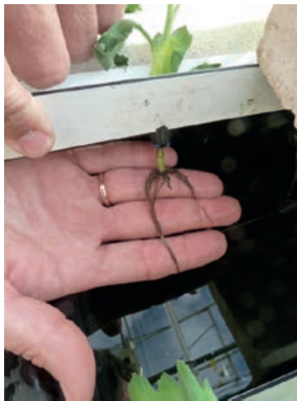
Foto Typisch ziektebeeld van de 'zomerwortelziekte': streperige roodverkleuring op de wortels gevolgd door volledige afsterving. De analyseresultaten van de wortels verschillen per lab tussen Pythium ultimum en Pythium myriotylum . Eerder werd bij een dergelijk ziektebeeld Fusarium solani gevonden.