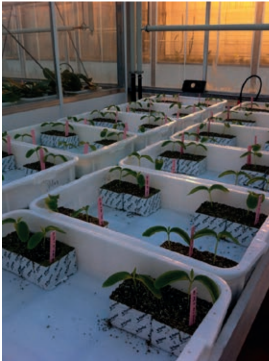
Figuur 2. Overzicht van een biotoets.

Uit deze inventarisatie zijn de twee meest gebruikte typen ontsmettingsapparatuur gekozen. Aan het eind van de enquête is gevraagd of het bedrijf bereid zou zijn om mee te werken aan het onderzoek wat betreft de effectiviteit van de ontsmetters. Uit deze lijst zijn tien bedrijven geselecteerd en hierbij is ook rekening gehouden met de ligging van de bedrijven in de verschillende teeltgebieden in Nederland. Voorwaarde om mee te doen was wel dat er komkommerbontvirus in de planten aanwezig moest zijn. Gedurende het teeltseizoen is 3 keer bemonsterd en daarbij zijn 10 submonsters genomen van water zowel voor als na de ontsmetter. De aanwezigheid van infectieus virus is vastgesteld door een ELISA test en door middel van een biotoets. Er is bewust gekozen voor beiden omdat bij een zeer lage concentratie virus dit eventueel niet wordt gedetecteerd door een ELISA test. Na het inoculeren op planten krijgt het virus de mogelijkheid om zich te vermeerderen en dat kan resulteren in symptomen op de planten. Hier gaat echter wel een aantal weken overheen voordat deze symptomen zichtbaar zijn.