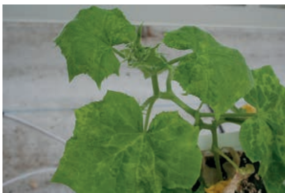
Figuur 2. Symptomen van komkommerbontvirus op een jonge komkommerplant.