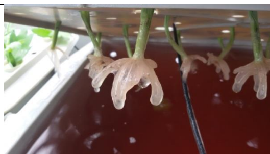
Fig. 1 Slijm rondom de wortels na aanenten met Pythium en Fusarium

Na 7 dagen (26 mei) zijn de behandeling 6,7, en 8 besmet met Fusarium + Pythium en 4 dagen was er rondom de wortels slijm te zien (fig. 1). Op 2 juni waren deze planten geel met minder bladoppervlak (fig. 2).